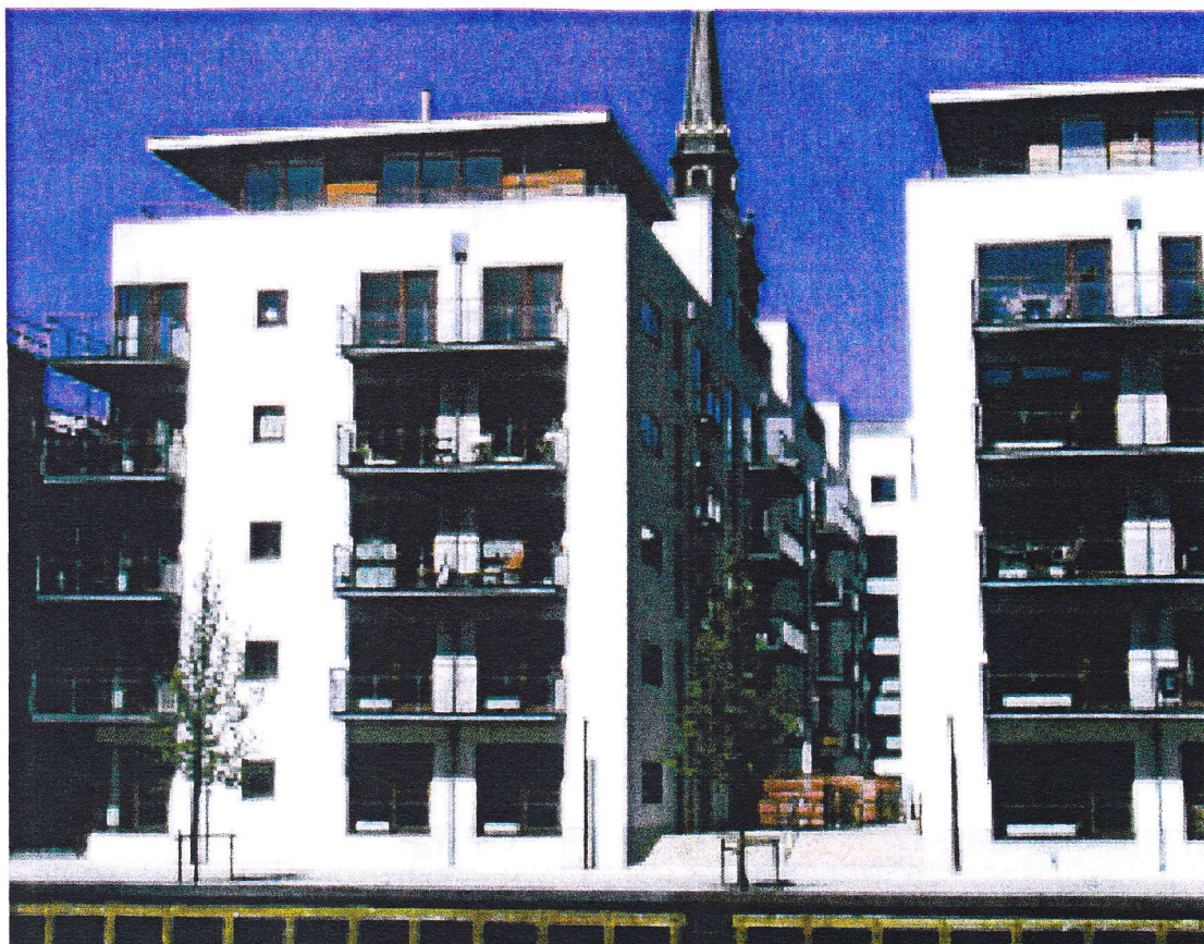
Løvensgård, Christianshavn. Arkitekt, Vilhelm Lauritzen tegnestue. Bygherre, Skanska

– typegodkendt postkasseanlæg med udtag forfra